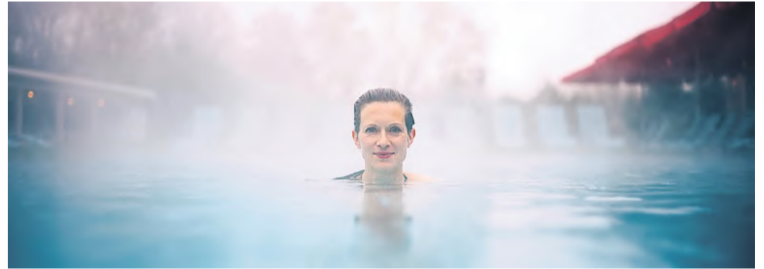
Das neue CalaSpa am Sundheimer Fort bietet Tages- und Hotelgästen Wellness mit Saunen und Schwimmbädern.

Mit dem Vier-Sterne Hotel „Calamus“ und seinen 99 Zimmern und Suiten, dem „Chattanooga-Grillrestaurant“, „Julias“ italienischem Restaurant, der „Orangerie“ für Festlichkeiten aller Art, einem Indoor Spiele- und Kletterpark Sensapolis Kehl, der modernen Autowaschanlage CalaCarWash sowie der Indoor-Elektro-Kartbahn CalaRace